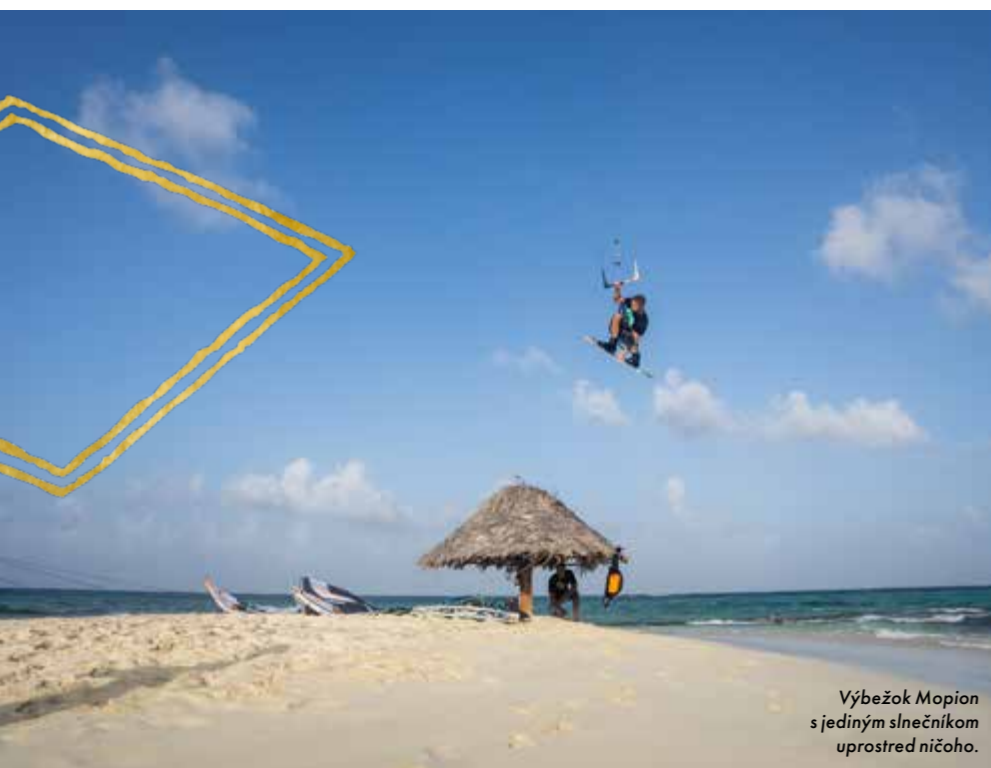
Výbežok Mopion s jediným slnečníkom uprostred ničoho.